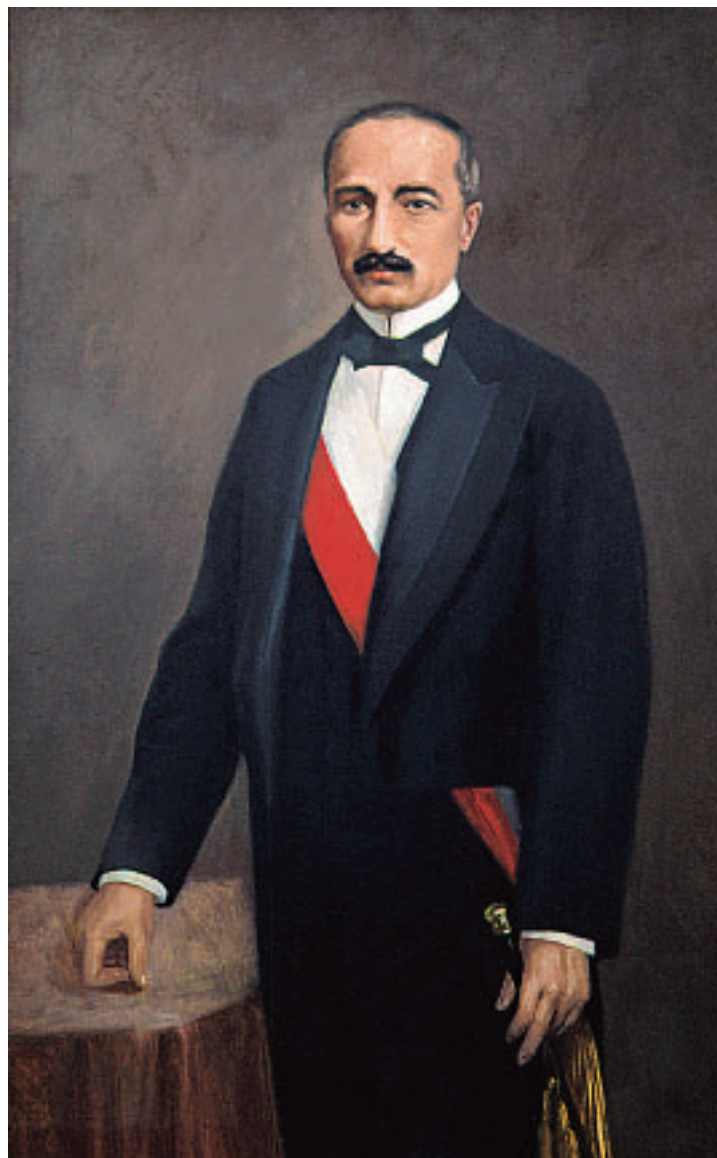
José Balta fue el presidente que impulsó la política ferrocarrilera del Perú (óleo existente en el Museo Nacional de Arqueología, Antropología e Historia).

muelle, adquirió barcos de todo tipo, hizo construir un aserradero en Mendocino Country y comenzó a atender con éxito las necesidades de los inmigrantes, todos ellos ansiosos de hacer fortuna con el “oro de California”. Meiggs se asoció con muchos buscadores del metal precioso. En los primeros años la bonanza sonrió a Meiggs en todas sus actividades, pero, en 1854 la suerte empezó a tornarse adversa, el negocio decayó porque muchos de sus importantes clientes se convirtieron en morosos y, atosigado por las deudas, presionado por sus acreedores, a quienes debía trescientos cincuenta mil dólares, se vio obligado a salir apresuradamente de San Francisco.