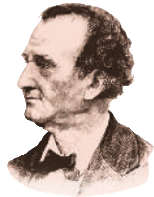
Enrique Meiggs según retrato hecho por Del Bocourt.

Agobiado por los problemas, el “Pizarro yanqui” se desmoronó y se volvió paralítico, por causa de una apoplejía. Dejó de existir en Lima el 30 de setiembre de 1877. Sus biógrafos dicen que Meiggs estaba en la total pobreza y lo único que le quedó del Perú fue la roca andina que cubre su tumba, pero es incuestionable que el “Pizarro yanqui” dejó en el Perú una de las más grandes obras que se haya hecho en su territorio, una red impresionante de ferrocarriles, que no se caracterizan tanto por su extensión sino por sus enrevesadas y caprichosas formas, la única manera de desplazarse por su difícil geografía.