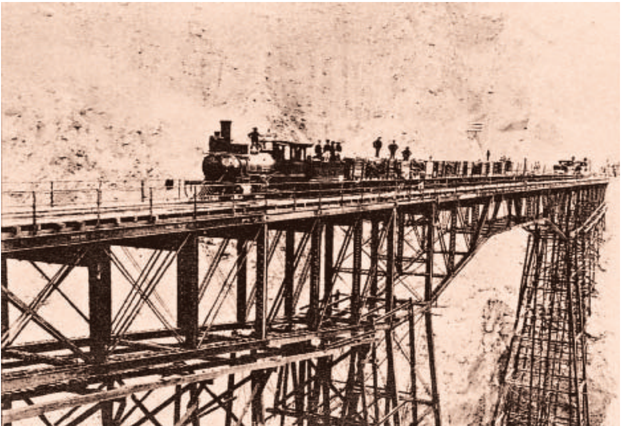
Puente Verrugas del Ferrocarril Central, grabado publicado en “Perú emergente”, periódico de la época.