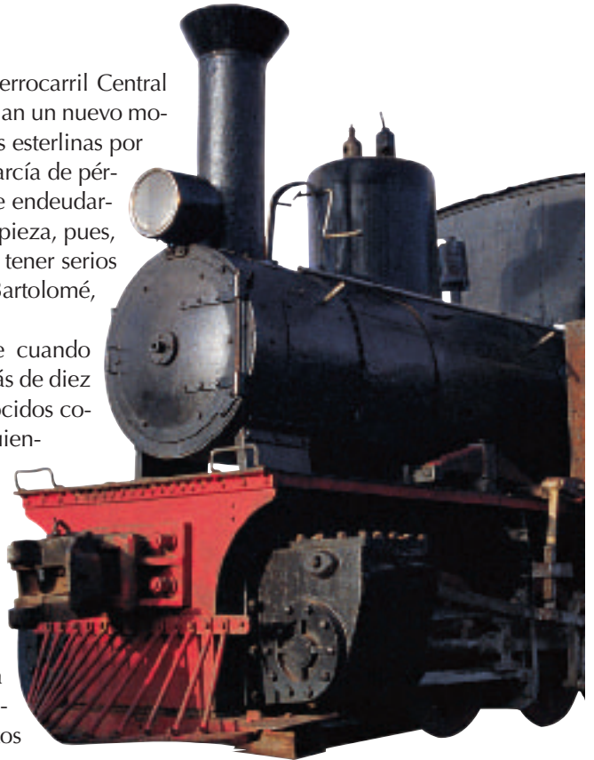
Una de las más antiguas locomotoras usada en el Ferrocarril Central del Perú.

a la altura de Tablones, a solo 57 km de Chimbote. Años después, dicha vía férrea se construyó hasta Yungaypampa, pero nunca llegó a Huaraz. Por último, el 31 de mayo de 1970, como consecuencia del aluvión provocado por el nevado Huascarán y la inundación del río Santa, dicho ferrocarril quedó totalmente dañado, tornándose irreparable.