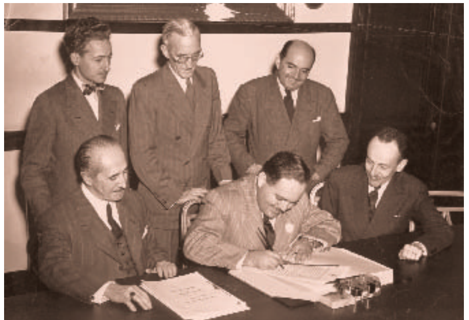
Basadre, junto a otros personajes, en la firma de un importante documento.

En este último año de sanmarquino, Basadre estuvo ligado con las luchas por la reivindicación social. Sus dirigentes fueron perseguidos por el gobierno de Leguía, entre ellos José Carlos Mariátegui, quien tuvo que recluirse en una clínica. Hildebrando Castro Pozo fue apresado junto a otros manifestantes, entre los cuales estuvo Basadre, a quien lo encarcelaron durante varios meses en el penal de San Lorenzo.