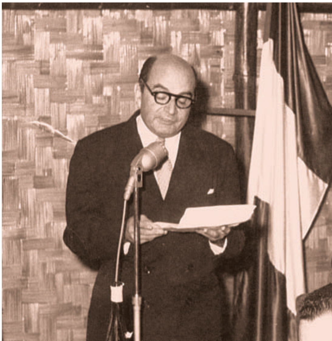
"Hoy, el objetivo educacional debe ser la formación del ciudadano auténtico", nos lo recordaba siempre Basadre.

Fue director del Departamento de Relaciones Culturales de la Unión Panamericana entre los años 1948 y 1950. Después, ocupó el cargo de presidente del Instituto de Historia.