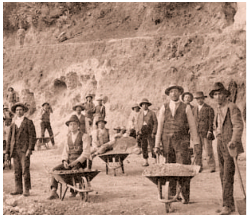
Basadre fue un permanente luchador contra la injusticia social durante el gobierno de Leguía, tal como ocurrió en la llamada "conscripción civil" o construcción de carreteras por los campesinos.

En 1945 fue nombrado ministro de Educación en el primer gabinete del Dr. José Luis Bustamante y Rivero, cargo en el que estuvo sólo tres me-