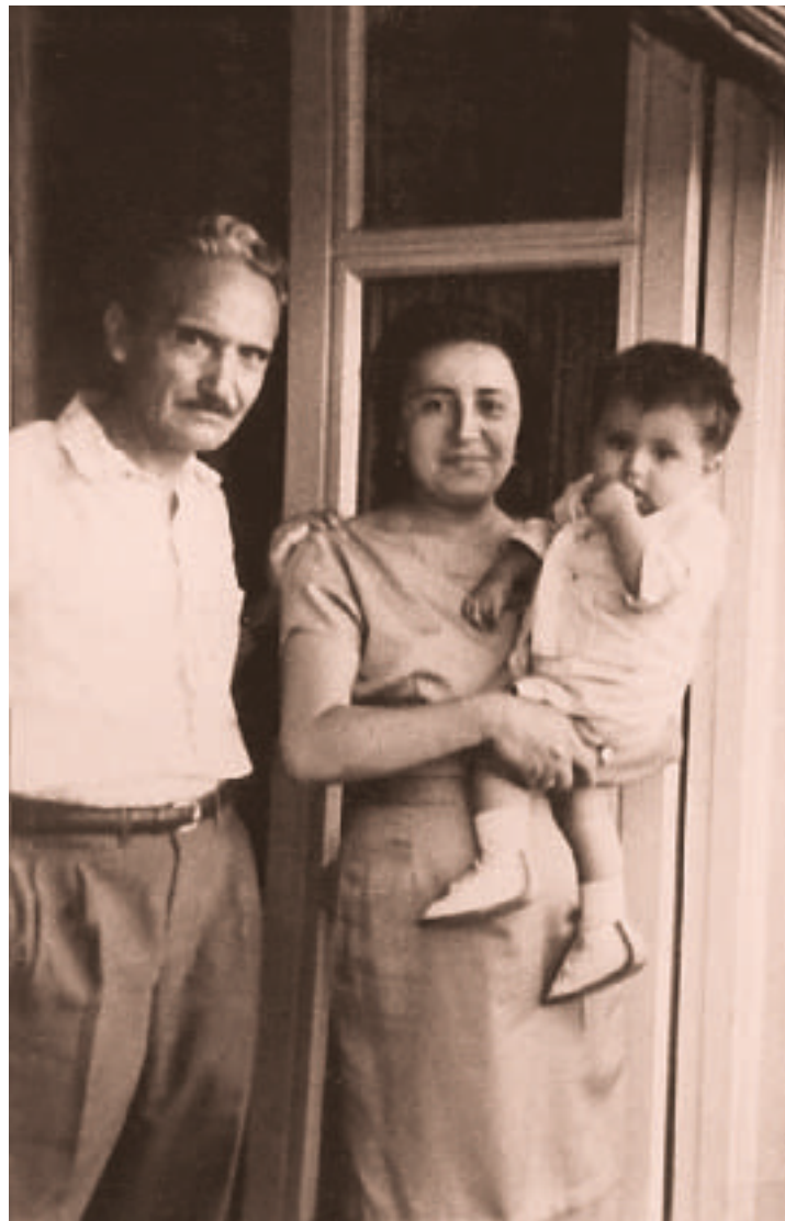
José María Arguedas y su familia.