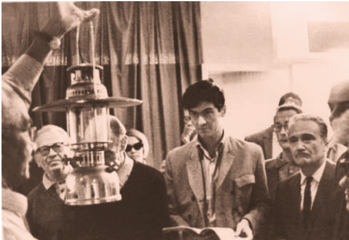
José María Arguedas acompañado por el poeta Antonio Cisneros y por otros intelectuales.