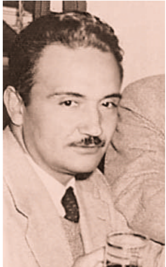
José María Arguedas, notable novelista en la plenitud de su vida.

En 1931 ingresó a la Universidad Nacional Mayor de San Marcos, a la Facultad de Letras, donde se graduó de bachiller el 20 de diciembre de 1957.