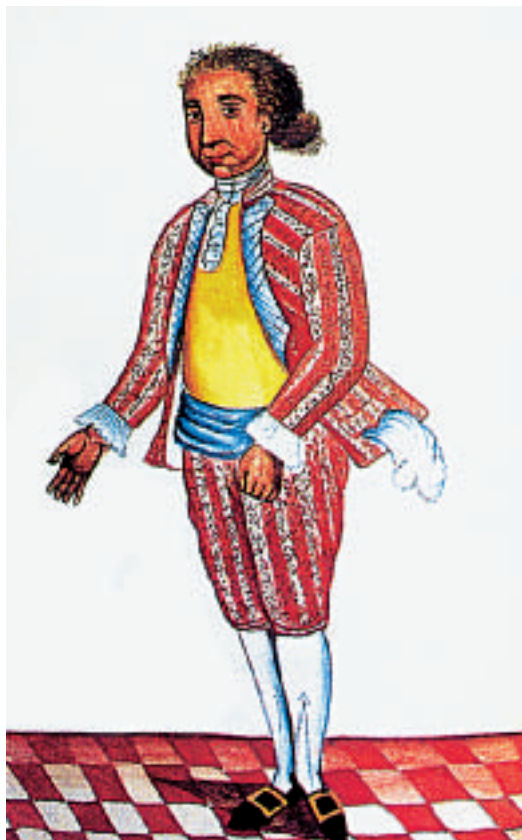
El zambo, como José Manuel Valdés, era producto del cruce entre un indio y una negra (acuarela colonial).

Pero, Valdés no se amilanó y logró el apoyo de Unanue y, como toda Lima sabía de sus méritos, el cabildo de la ciudad solicitó a Carlos IV el “respectivo permiso para que Valdés pueda terminar y ejercer su carrera de medicina”. Carlos IV lo autorizó y su histórico documento llegó a Lima el 11 de junio de 1806.