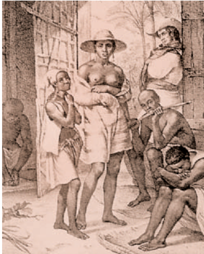
Una barraca de esclavos resguardada por un policía del hacendado. Los esclavos más sanos y fuertes eran bien cuidados y se los vigilaba permanentemente (pintura colonial).