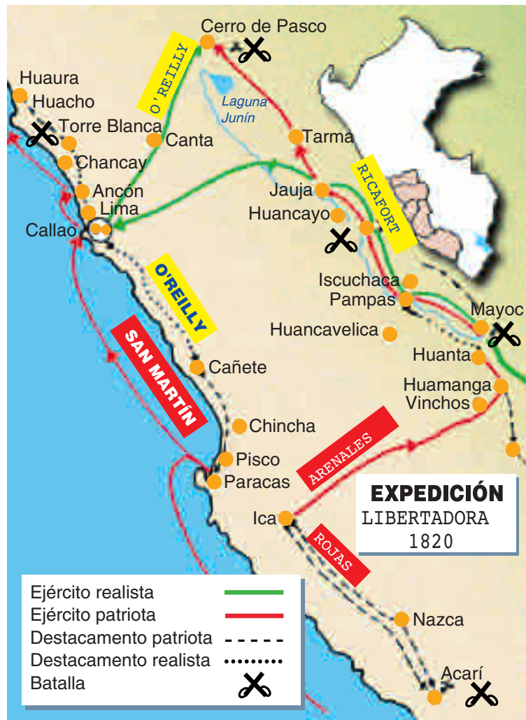
Mapa de la expedición libertadora de San Martín. Las tropas de Álvarez de Arenales influyeron en el destino de hombres y mujeres del centro del Perú.

El 29 de marzo de 1822, las tropas patriotas desalojaron sorpresivamente la localidad de Quilcamachay porque fueron avisadas por María Parado de Bellido que iban a ser emboscadas por los realistas. Se salvaron cientos de personas. En efecto, el 30 de marzo de 1822, los realistas tomaron dicha localidad, buscaron por todas partes y no hallaron a ningún soldado patriota. Hurgaron en los pertrechos dejados y en una vieja alforja encontraron una misiva de María Parado de Bellido dirigida a su esposo.