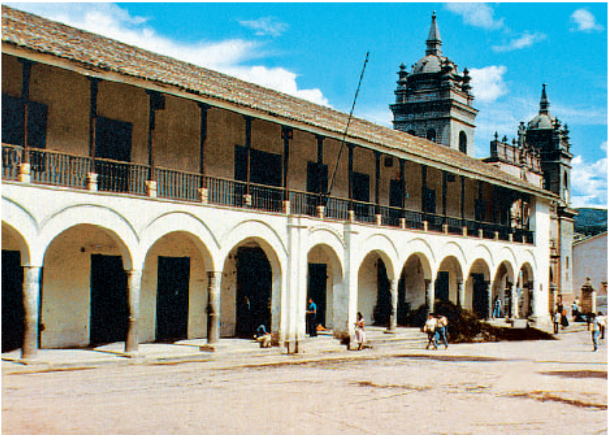
Catedral y portales de Ayacucho, donde Micaela Bastidas dio su vida por la libertad de su pueblo.

cer a María Parado de Bellido de que denuncie a los colaboradores patriotas ordenó que quemasen la casa de la heroína. Allí estaban sus hijas, temblando de tristeza y miedo, porque los ayacuchanos les informaban minuto a minuto de lo que pasaba en el cuartel de los realistas con su madre. También les anunciaron que un piquete de soldados se acercaban a la casa para cumplir la orden de Carratalá y que tenían que escaparse. Así lo hicieron, salvándose de ser quemadas vivas.