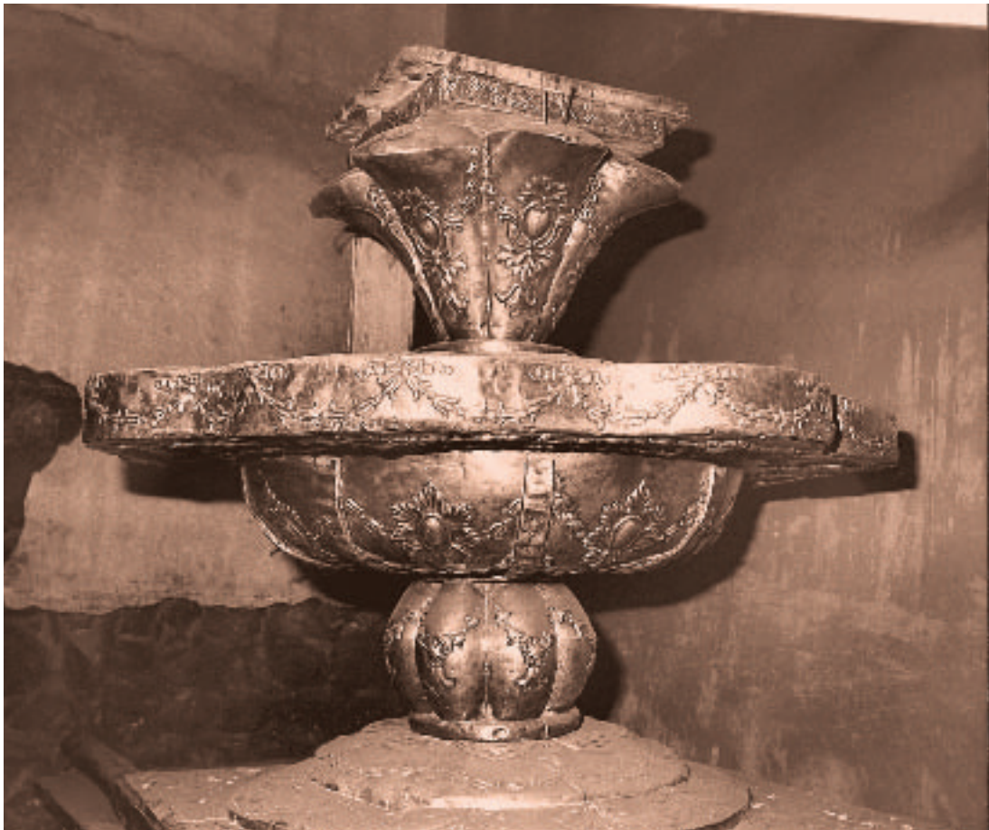
Parte de una anda de plata que se conserva en la iglesia de Urquillo, un pueblo del valle de Urubamba, y que Pumacahua había obsequiado para la Virgen del Carmen.

En Umachiri dirige la artillería. Al ver que sus soldados iban muriendo, se apea del caballo y él mismo maneja el cañón, hasta que cae prisionero ante los soldados de Ramírez. Su actitud frente a los jueces realistas y al pelotón de fusilamiento fue la de todo un héroe: estoico, sereno, grande. Murió el 11 de marzo de 1815.