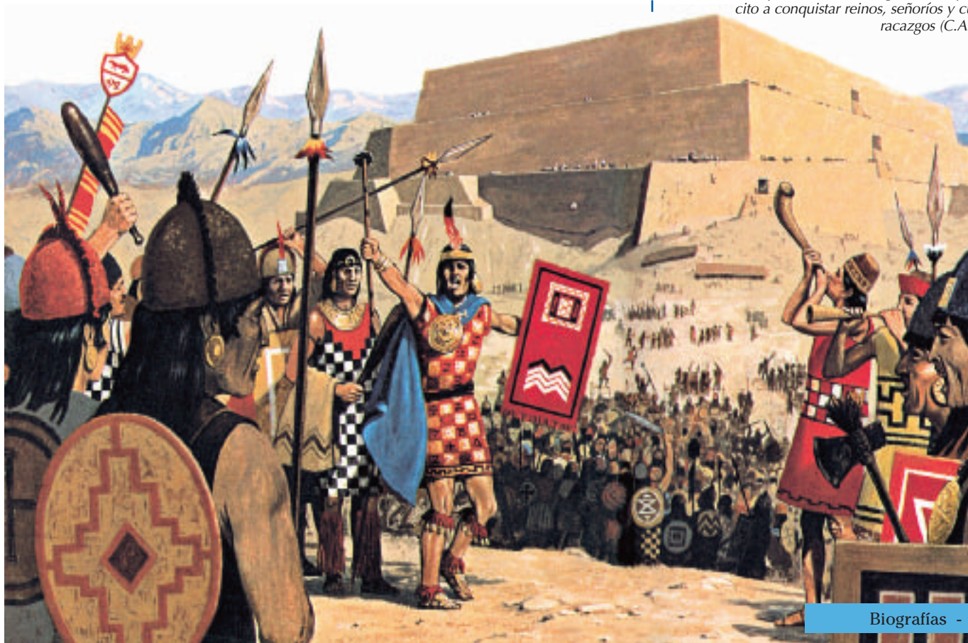
El Zapa Inca real se dirige con su ejército a conquistar reinos, señoríos y curacazgos (C.A.).