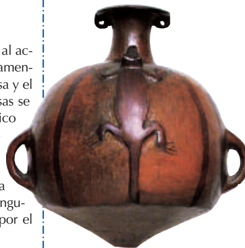
Junto a las tropas de Pachacútec se iba difundiendo en el mundo andino el aríbalo, huaco estilo inca.

El ejército imperial pasó a Cajamarca. Planteada la rendición por los emisarios del Inca, los curacas de los caxamarcas respondieron que preferían morir por defender su libertad. Luego, los caxamarcas se atrincheraron en los "pasos fuertes", donde se produjeron enconadas peleas, y murieron miles de soldados, de ambos bandos. Lo mismo ocurrió en las batallas a campo abierto. Pero el poder de los incas obligó a los caxamarcas a atrin-