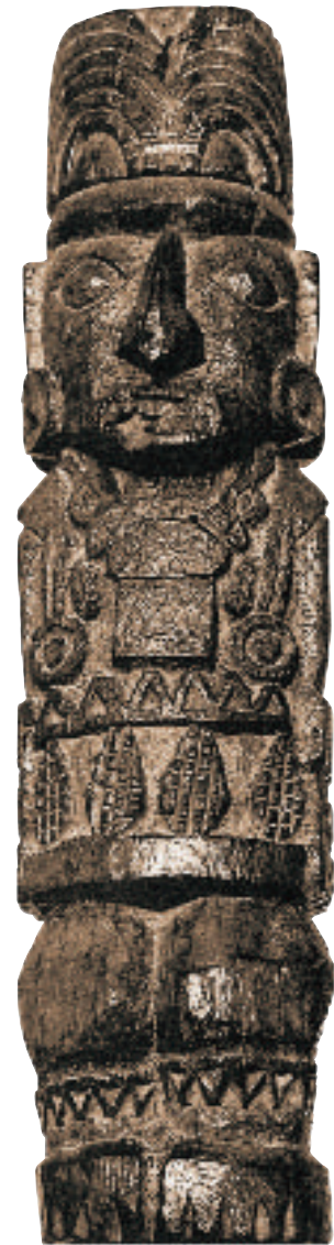
Por el tratado entre incas y cuzimancus se logró, entre otras cosas, la unión de los dioses más poderosos del Ande: Inti y Pachacámac, cuyo idolillo de madera aparece en esta fotografía.

Hecho el descanso, dadas las disposiciones correspondientes a los curacas y funcionarios reales y recibido un nuevo reabastecimiento de las tropas, Pachacútec ordenó a Cápac Yupanqui que pase a la costa central del Chinchasuyu, donde estaba el reino de Cuzimancu y que se extendía por los valles de Pachacámac, Rímac, Chancay y Huaman. Al escuchar los aperebimientos del Inca, el rey de Cuzimancu le mandó decir que sus dioses Pachacámac ("hacedor y sustentador del mundo"), Rímac ("el que habla") y Mamacocha ("madre-mar"): "... eran superiores al Inti, por lo que se consideraba tan rey como el del Cozco". Como los incas también reconocían a Pachacámac como dios, a pesar de no conocerlo, porque su fama venía desde antes, Cápac Yupanqui reiteró su petición de un so-