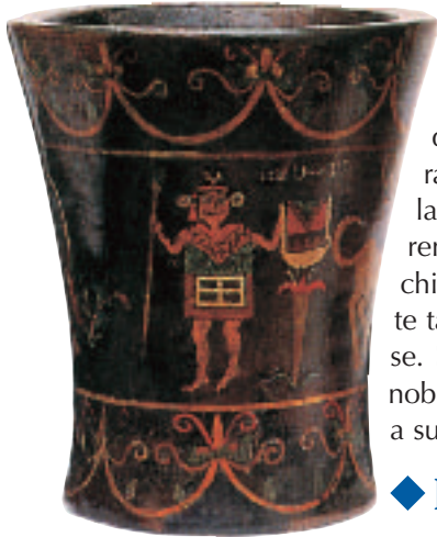
Vaso ceremonial Inca con estampa de guerrero.

dios Chinchacámac ("sustentador de Chincha") para no caer en poder de los incas. Pachacútec, con la paciencia agotada, les mandó decir que si no se rendían en ocho días: "... les pasaría a todos a cuchillo y traería nueva gente a poblar sus valles". Ante tal amenaza, los chinchanos tuvieron que rendirse. El curaca, acompañado de sus parientes y otros nobles, fue a besar las manos del Inca, sometiéndose a su mandato.