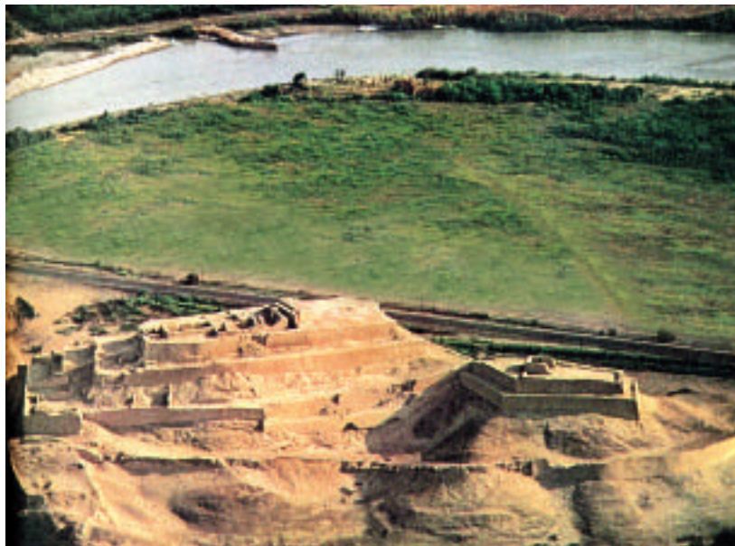
Fortaleza de Paramonga ("Parmunca"), a orillas del río Pativilca, provincia de Barranca, Lima. Fue el principal sitio de sentencia de los chimú.

Entre tanto, Pachacútec mandó mensajeros a Chíncha para que su poderoso y rico curaca decida someterse a sus dominios. Para todos los reinos costeros, la "mamacocha" ("madre mar") era el centro de su mitología. La adoraban porque, gracias a los peces que ella les daba, vivían bien. También por el guano de sus islas. Ello ocurría desde Puná hasta Tarapacá. En nombre de la "mamacocha", los habitantes de Chíncha rechazaron la religión y el vasallaje que los incas les ofrecían. Además, porque el rey de Chíncha se creyó tan rico como el del Cusco. Ante la inesperada respuesta, los incas se dirigieron al norte, hacia el reino de Chíncha. El ejército de