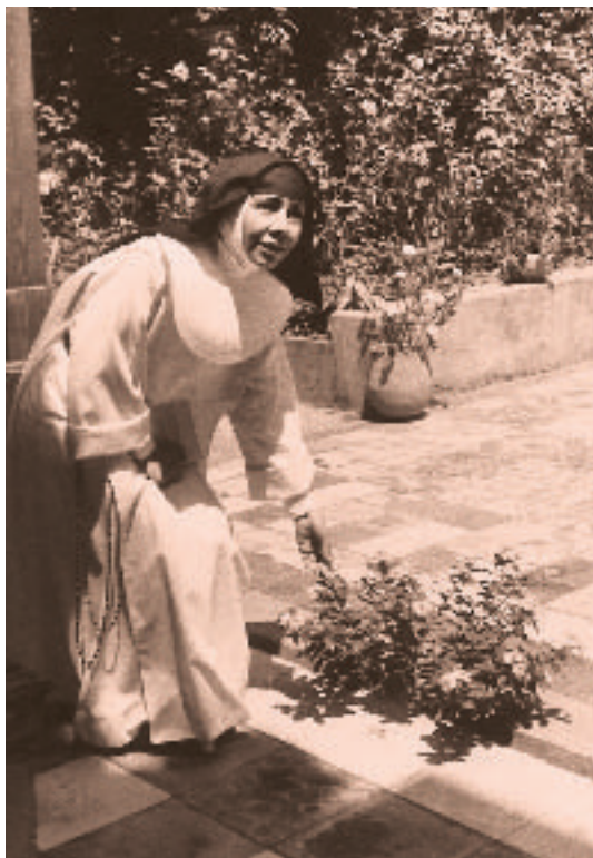
Una terciaria deposita una ofrenda floral en honor a Santa Rosa en uno de los pasillos del convento de Santo Domingo.

Sin duda emplearían toda su diligencia, afañes y desvelos en buscar penas y aflicciones; andarían todos por el mundo en busca de molestias, enfermedades y tormentos, en vez de aventuras, por conseguir el tesoro último de la constancia en el sufrimiento. Nadie se quejaría de la cruz ni de los trabajos que le caen en suerte, si conocieran las balanzas donde se pesan para repartirlos entre los hombres”.