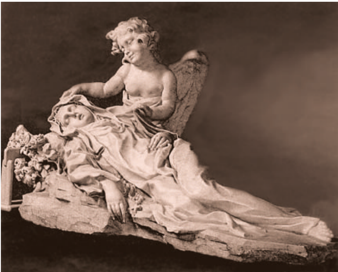
Santa Rosa de Lima yacente, en el Convento de Santo Domingo, Lima.

Y haciendo todas admiración; este testigo desde el aposento donde estaba la vio hacer extremos y sin