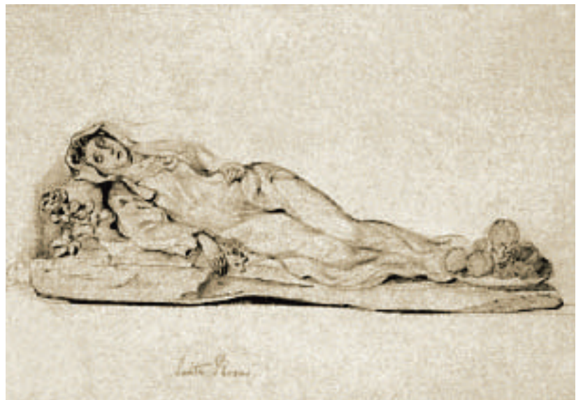
Santa Rosa de Lima, según apunte del viajero francés Rugendas.