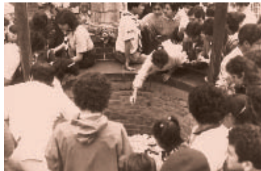
El 30 de agosto de cada año es tradición limeña que los devotos de Santa Rosa visiten la iglesia de Santa Rosa y depositen en un pozo seco sus cartas, pidiéndole a la santa que se cumplan sus tres deseos.